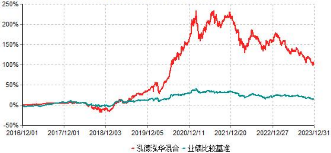
泓德泓华灵活配置混合型证券投资基金累计净值增长率与业绩比较基准收益率历史走势对比图 (2016年12月01日-2023年12月31日)

注：根据基金合同的约定，本基金建仓期为6个月，截至报告期末，本基金的各项投资比例符合基金合同关于投资范围及投资限制规定。